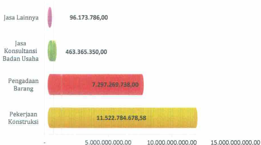
Grafik Penghematan atas pagu anggaran