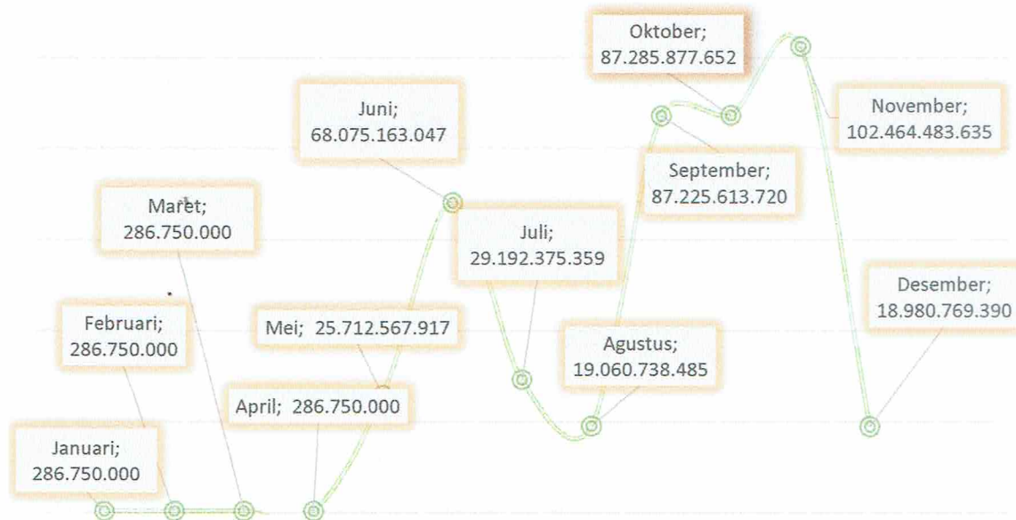
Grafik Prognosis Perkiraan Pengajuan SP2D-LS