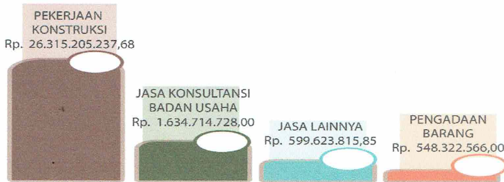
Grafik Penghematan atas Pagu Anggaran